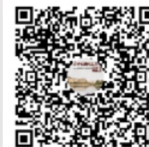
辽宁石油化工大学学报00群